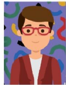
Foto com fundo colorido ou muito escuro; Cabelo não está totalmente alinhado dentro da foto; Excesso de maquiagem nos olhos.