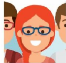
Foto recortada de outra imagem; Proporção fora do padrão 3X4.