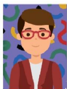
Foto com fundo colorido ou muito escuro; Cabelo não está totalmente alinhado dentro da foto; Excesso de maquiagem nos olhos.